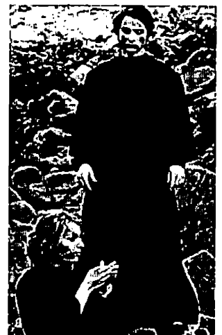
Bernadette Lafont et Jean-Pierre Léaud